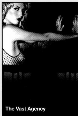
The Vast Agency