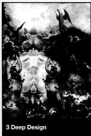
3 Deep Design