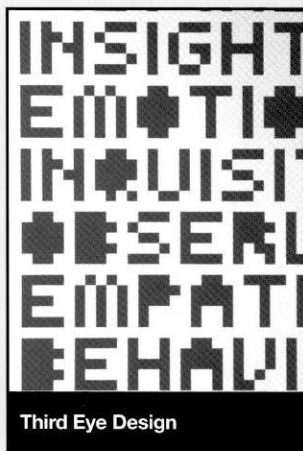
Third Eye Design